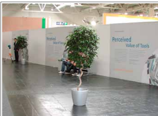
1.4 Ficus - Kugel