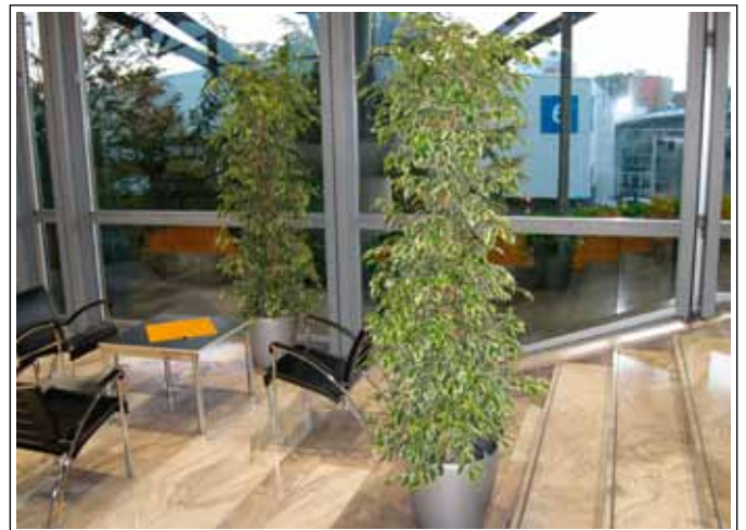
1.4 Ficus - bunt