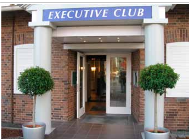
1.6 Prunus - Kugel