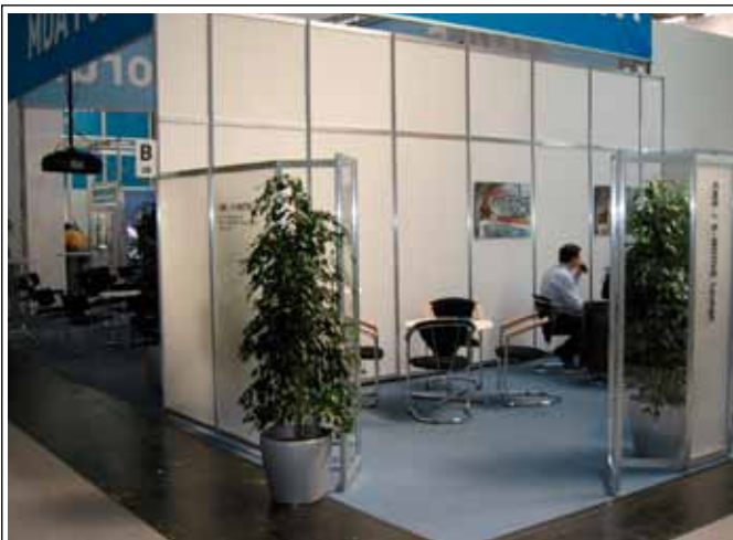
1.4 Ficus - grün