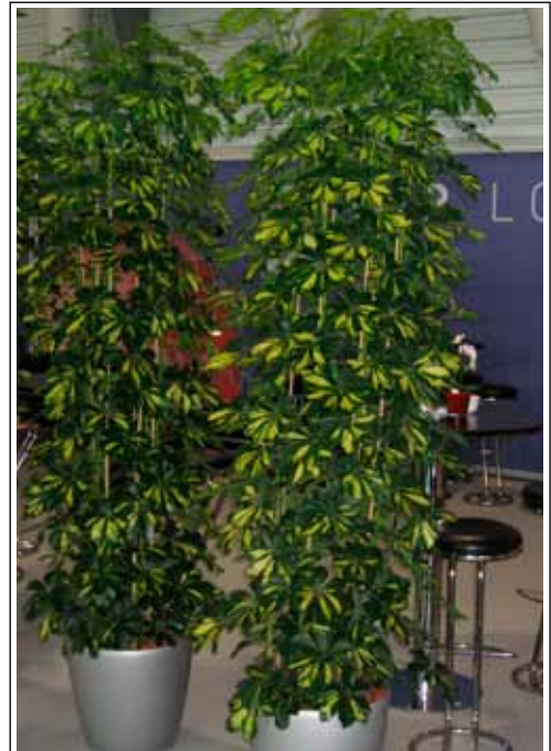
1.5 Schefflera - Säule