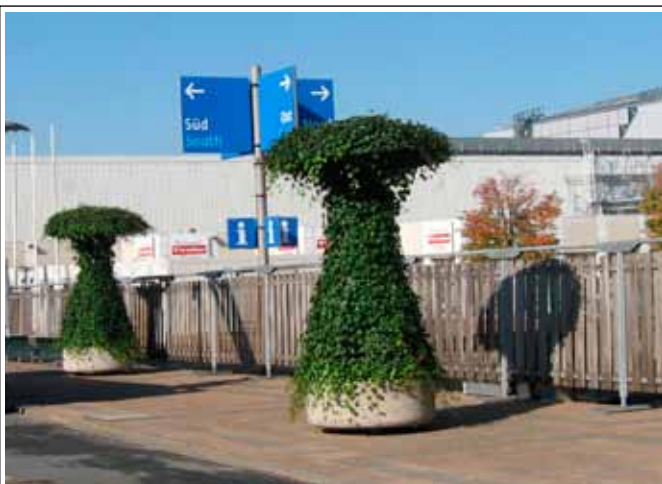
2.5 Efeu - Turm