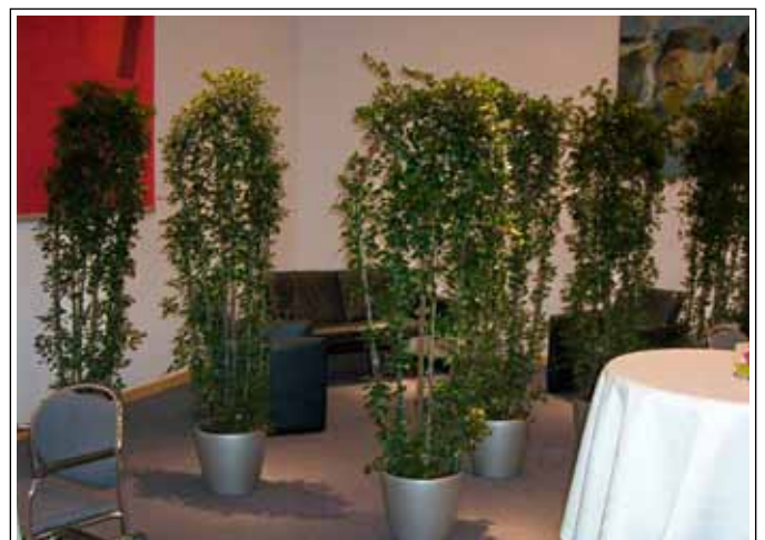
1.4 Ficus - Spalier